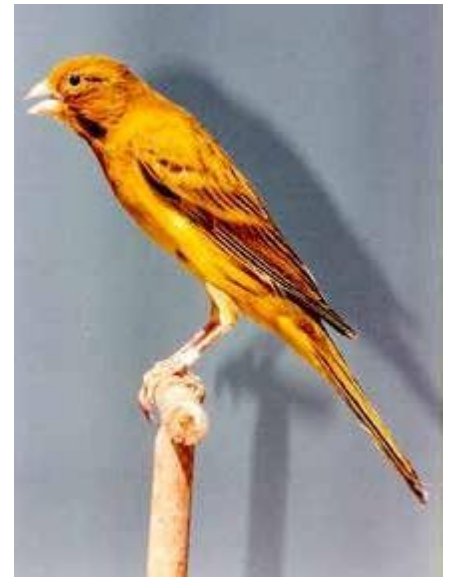
Fotografías de Llarguets del año 1971